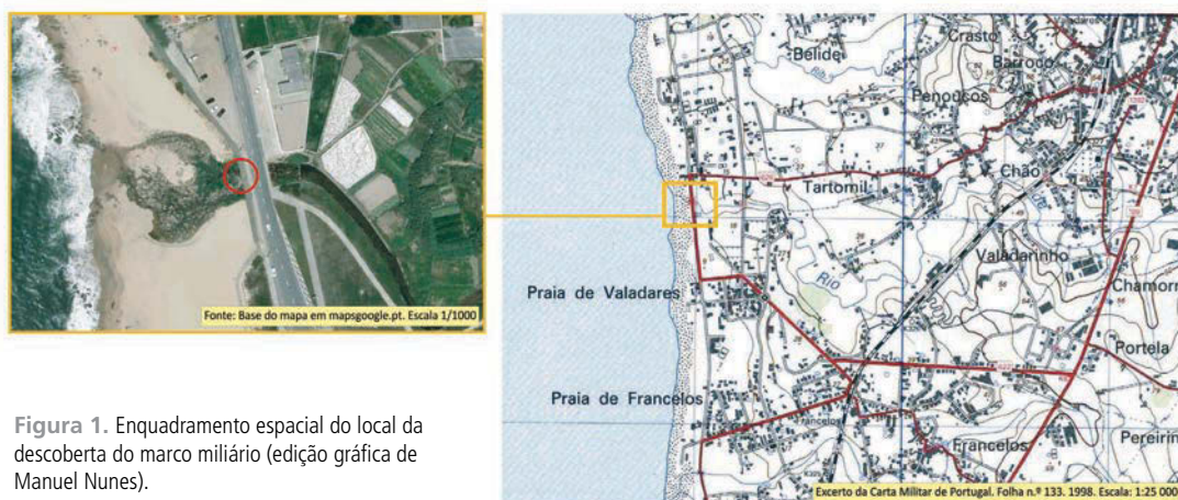
Figura 1. Enquadramento espacial do local da descoberta do marco miliário (edição gráfica de Manuel Nunes).

Nesse sentido e mediante conhecimento/ consentimento do então, IPA (Instituto Português de Arqueologia), IPPAR (Instituto Português do Património Arquitetónico), Pelouro da Cultura de Vila Nova de Gaia e Presidente da Junta de Freguesia o marco miliário foi provisoriamente mantido em reserva científica dos seus descobridores e após o seu estudo preliminar