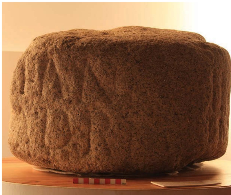
Figura 3. Fragmento do marco miliário de Caracalla com campo epigráfico em destaque.

todo o trabalho terá sido empreendido com o máximo cuidado e com a preocupação de deixar intactas as letras que revelam o prestígio do objeto arqueológico, como no ponto 4.2. se explanará. Saliente-se que em Espanha, na localidade de Aciveiro - San Xoán de Río foi encontrado um marco dedicado ao imperador Marco Aurélio Caro cujas dimensões e características morfológicas são em tudo idênticas às do marco em análise, neste caso pela reutilização como contrapeso de lagar (Colmenero,2004:574).