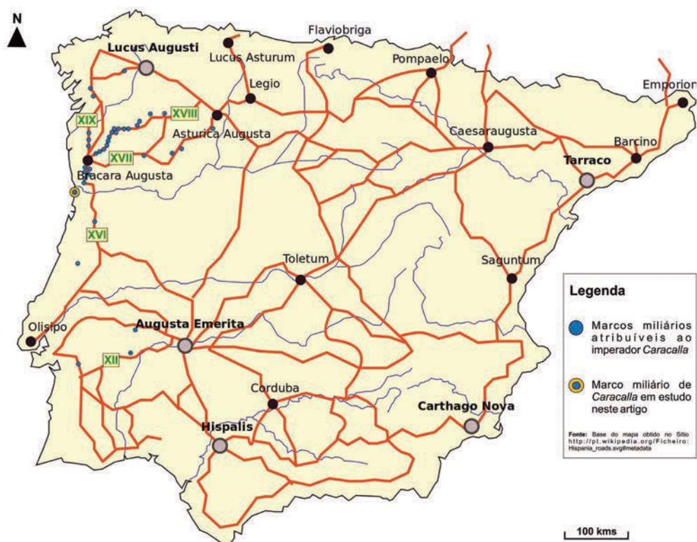
Figura 8. Mapa de dispersão dos marcos miliários de Caracalla no território nacional e noroeste peninsular (edição gráfica de Manuel Nunes).

A nível espacial, o seu investimento viário é notavelmente maior no noroeste peninsular, aliás, Caracalla apresenta-se com o conjunto