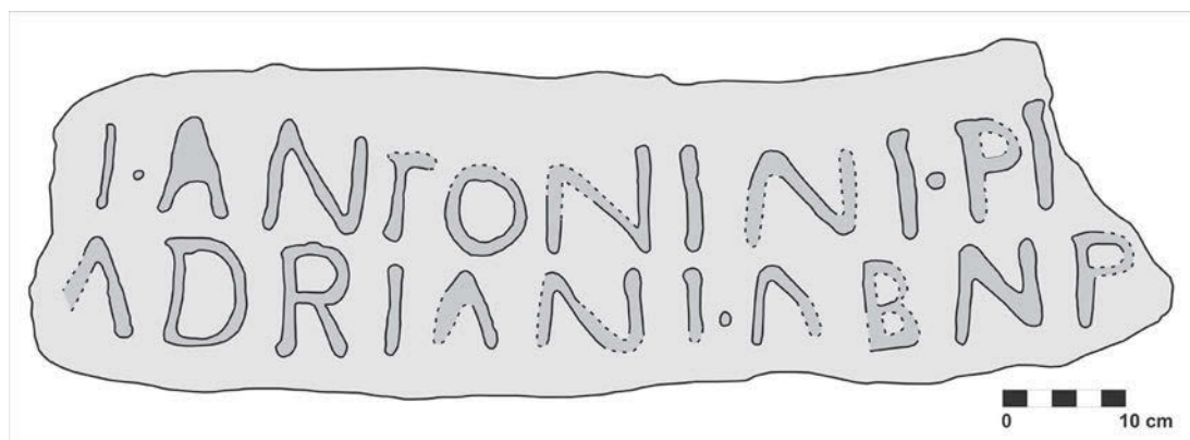
Figura 4. Decalque do campo epigráfico remanescente do marco miliário (edição gráfica de Paulo Lemos e decalque de Joana Leite).

Tal como nos demais marcos miliários conhecidos do imperador Caracalla para o território nacional e mesmo para o noroeste peninsular, que perfazem um total de 38 (Fig. 7), os caracteres apresentam uma modelação quase uniforme, com variações entre os 8/9cm de altura e os espaços interlineares entre os 1,5cm e os 2,5cm (podendo chegar aos 4cm em outros