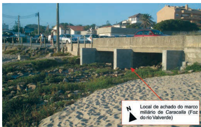
Figura 2. Pormenor do local da descoberta do marco miliário (edição gráfica de Manuel Nunes e fotografia de Joana Leite).

Trata-se portanto de um marco miliário já muito fustigado, diminuído não só nas dimensões da sua altura como nas do seu perímetro que é reduzido a metade pelo cuidado corte transversal que lhe é feito à posteriori (provavelmente ainda durante a Idade Média) fruto da reutilização entretanto equacionada e que atualmente se desconhece. Marcas dessa reutilização são ainda os entalhes que apresenta no topo e na base para eventual encaixe. Note-se que, no momento em que se terá partido intencionalmente o marco,