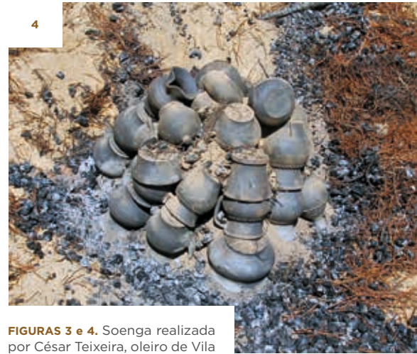
FIGURAS 3 e 4. Soenga realizada por César Teixeira, oleiro de Vila Seca (Gondar).