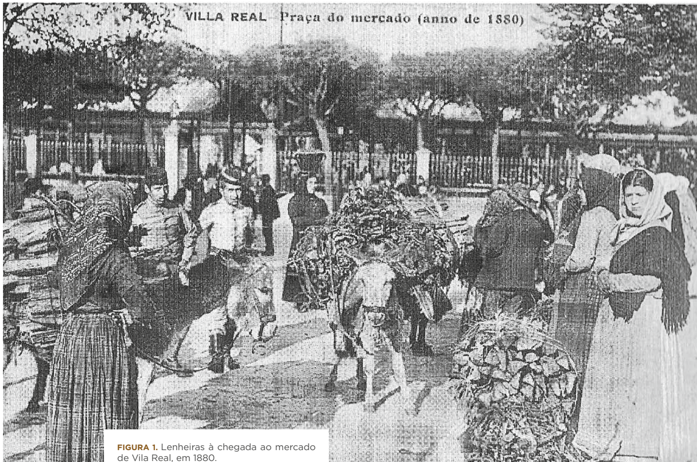
FIGURA 1. Lenheiras à chegada ao mercado de Vila Real, em 1880.

Embora para o concelho de Amarante não se disponha de qualquer documento iconográfico, semelhante ao existente para a capital transmontana, um respigo pela documentação paroquial também nos fornece informação relevante sobre a matéria. Efetivamente, os registos paroquiais de Aboim, Chapa e Gondar identificam algumas mulheres, apontadas como lenheiras, circunstância que é de realçar, atendendo a que os párocos, de uma forma geral, não mencionam a ocupação dos sujeitos citados nos assentos de batismo, casamento e óbito, as fontes primárias manuseadas.