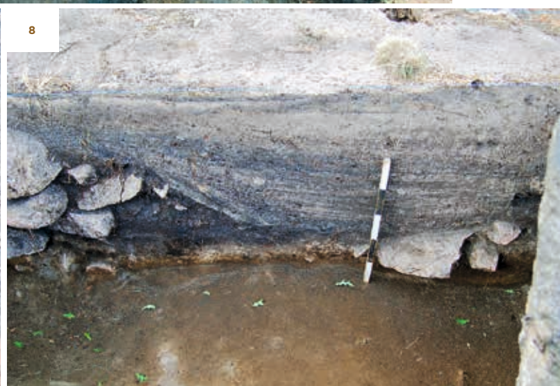
FIGURAS 6, 7 e 8. Plano e perfis de fossas de fazer carvão, identificadas no Castro do Crastoeiro.