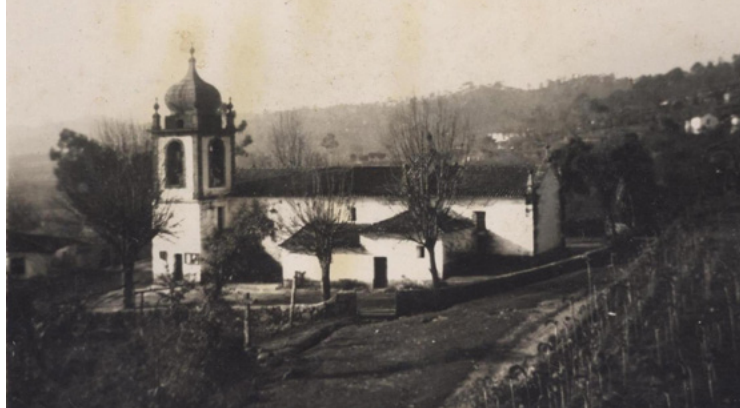
FIGURA 2 Vista geral da igreja paroquial de Covas em 1956.

Sobre a construção desta nova igreja importa atender ao que foi escrito pelo padre Francisco Peixoto logo nos dois primeiros artigos dedicados a Covas integrados na coleção denominada «Louzada. Sua origem e antiguidades» e publicados no Jornal de Louzada. O célebre abade de Covas, primeiro estudioso da história e arqueologia do concelho, menciona a existência de dois manuscritos preservados no cartório paroquial da freguesia. Numa nota de um desses manuscritos (entretanto perdidos) depa-rou-se com a referência a dois padres que fizeram de novo esta igreja . Tratava-se dos padres Gonçalo Coelho e João de Meireles Freire que, por meados do século XVII terão custeado as obras de reedificação do corpo da igreja. Em virtude de tão importante obra pia terão obtido o privilégio de receberem sepultura nas campas dispostas sob o arco-cruzeiro 4 .