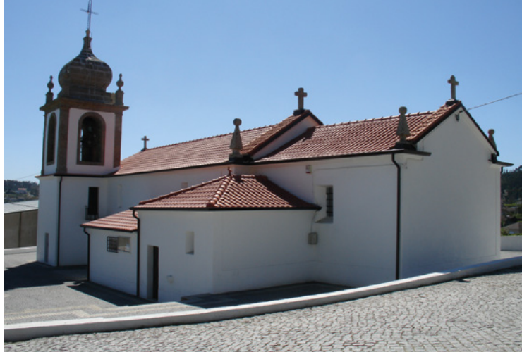
FIGURA 3 Perspetiva Este da igreja paroquial de Covas ao presente.