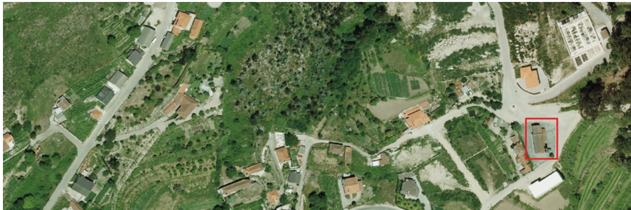
FIGURA 1 Integração atual da igreja paroquial de Covas na paisagem circundante

Não seria, no entanto, inédito o derrube total de uma velha igreja para, no mesmo lugar, se construir novo templo, aplicando-se os materiais dos escombros em edificações vizinhas. No entanto, importa atender ao que vinha plasmado nas Constituições Sinodais relativamente à mudança da igreja para outro local. Nesse caso, os altares, as imagens e a pia batismal tinham de ser transferidos para a igreja nova, assim como os ossos dos defuntos deveriam