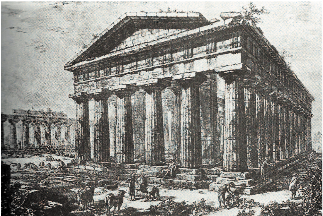
Figura 1. G. B. Piranesi – Os templos de Paestum em 1778. Fonte: BENEVOLO, L. (2001) – História da Arquitectura Moderna. São Paulo: Editora Perspectiva, p.25.

Pode considerar-se que a Revolução Francesa é o momento de viragem, no que diz respeito ao conceito de salvaguarda do património, mais próximo do significado que conhecemos. De forma a deter o vandalismo ideológico, relacionado com a monarquia, a religião e o feudalismo, que se concretizou no desaparecimento e degradação de vários monumentos e obras de arte importantes (com maior incidência em bens ligados ao clero), foi criado um conjunto de normas, considerado pioneiro para o desenvolvimento de políticas de intervenção em edifícios históricos. Foram levantadas questões relativas à selecção de edifícios a restaurar e à forma de como levar a cabo esse mesmo restauro. Pela primeira vez a entidade Estado assume a responsabilidade na defesa dos monumentos e edifícios de interesse nacional.