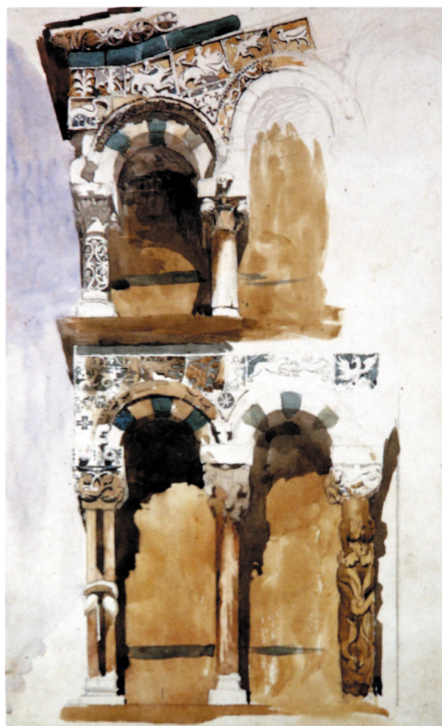
Figura 3. Jonh Ruskin - Part of the Façade, San Michele, Lucca.

Do Congresso Internacional de Arquitectura e Técnicas dos Monumentos Históricos, realizado em 1964, resulta a Carta de Veneza, sobre a conservação e restauro de monumentos e sítios, que define os princípios orientadores sobre a protecção do Património, alargados ao espaço urbano. Este documento contribui ainda para a ideia de significado cultural do património, defendendo a extensão do seu conceito às obras