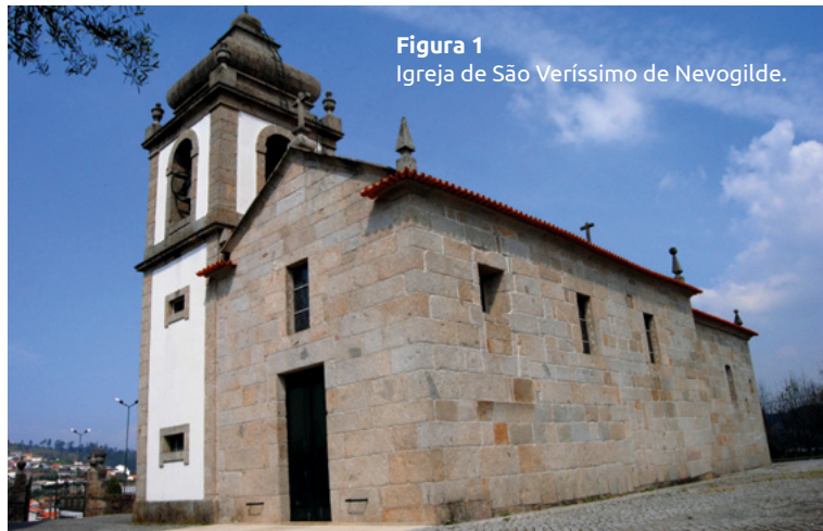
Figura 1 Igreja de São Veríssimo de Nevogilde.